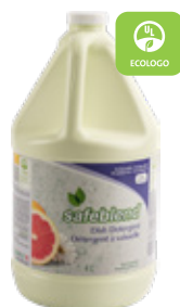
■ Pamplemousse rose ■ Code : VCPG