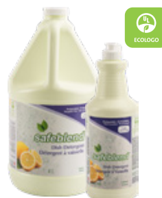
■ Citron ■ Code : VCLE