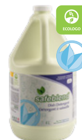
■ Sans parfum ■ Code : VCXX